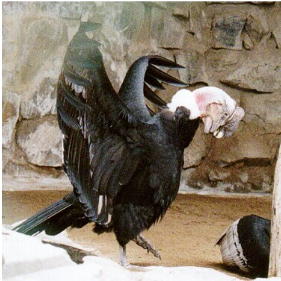
Een Andes-condor in de dierentuin van Artis in Amsterdam

De oorspronkelijke culturen van vele niet-westerse volken zitten tegenwoordig nogal in de verdrukking door de ook plaatselijk sterk gegroeide populariteit van televisie en popmuziek. Ook de Aymara's dreigen in een identiteitscrisis ten onder te gaan. Maar de parallel met de condor blijft zichtbaar: ook de condor is inmiddels een bedreigde diersoort.