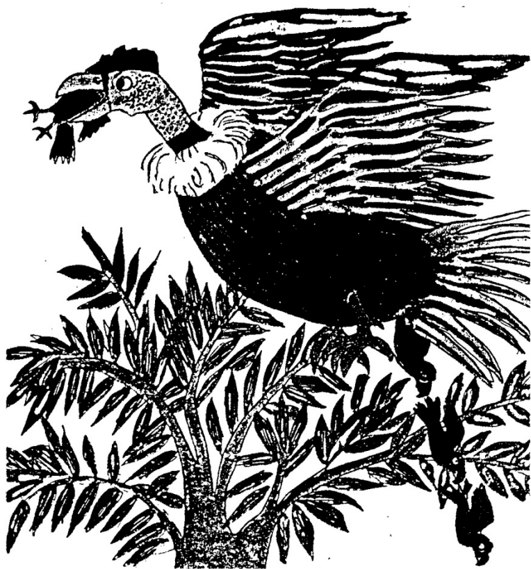
De condor en het herderinnetje