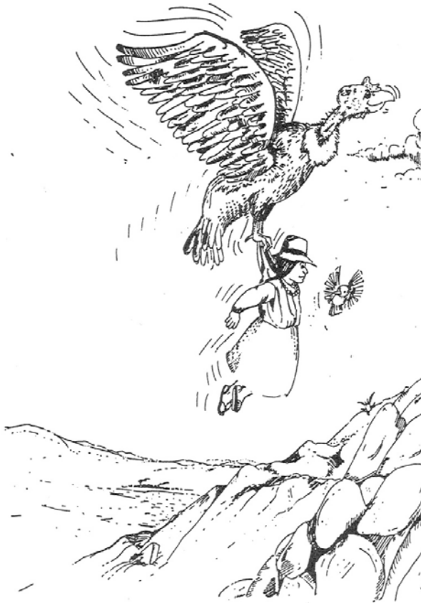
De condor en het herderinnetje

In de voorgaande verhalen is de condor - als vertegenwoordiger van het Aymaravolk, tegenover de vos, als vervreemdend element - een strenge, maar rechtvaardige en dus een goede macht. Hij is de "ordehandhaver", een bewaker van het Aymara- of Andeseigene tegen het kwade vreemde. Maar de condor is niet altijd een goede macht geweest, integendeel: