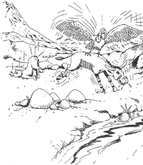
De condor en mevrouw de vos

De Condor en Mevrouw de Vos hadden afgesproken samen een ezel te jagen, omdat ze erge honger hadden. Ze spraken af dat de Vos de ezel in de nek zou pakken en dat de Condor de ezel in de flank neemt. Als de ezel echter door beiden te grazen is genomen, zet hij het op een lopen, terwijl hij alle kanten op springt en slaat, zodat Mevrouw de Vos moet loslaten. De ezel maakt hiervan gebruik om Mevrouw de Vos dood te schoppen. Het blijkt maar weer eens dat zowel Meneer de Vos als Mevrouw de Vos altijd het onderspit moet delven.