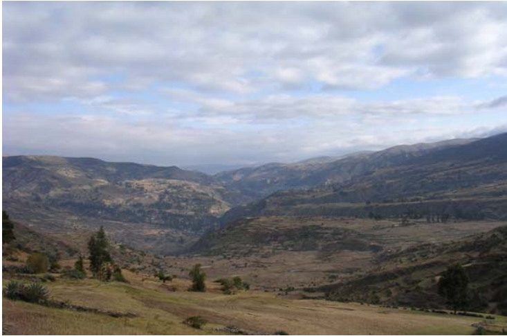
De sierra bij Ayacucho.

Landbouwproducten vormen het grootste bestanddeel. Deze zijn over het algemeen onder te verdelen in de graangewassen maïs, tarwe, gerst, quinua en quiwicha , de knolgewassen aardappel, oca , olluco en mashua en peulvruchten als tuinbonen, erwten en bonen. In de kleine tuintjes, huertas , rondom het huis wordt groente, kruiden en in sommige gevallen fruit verbouwd.