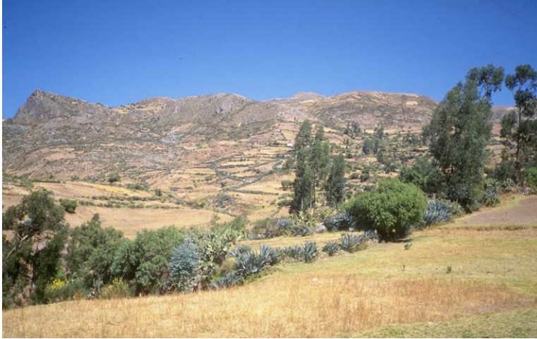
De Wamani Punta Urcco (de puntige berg links op de foto) waakt over het welzijn van Pomacocha, een kleine gemeenschap in de het departement Ayacucho.

heersen in het departement Ayacucho twee regionale Wamani's. In het noorden heerst Rasuwillka en in het zuiden Qarwarasu .