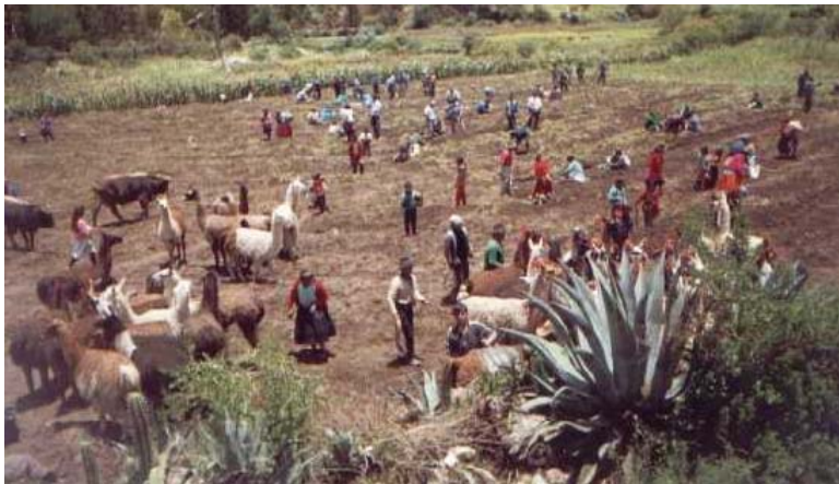
Het gezamenlijk oogsten.

Het is onmogelijk voor een gezin om alle agrarische taken alleen uit te voeren. De bewoners hebben daarom een wederkerig organisatiesysteem ontwikkeld. Bij de belangrijkste taken binnen de agrarische jaarkalender maar ook bij levensrituelen, feesten, en dergelijke kan het gezin rekenen op de hulp van de uitgebreide familie 1 . Deze hulp kan worden terugbetaald door middel van een gelijke wederdienst, ayni , of door uitbetaling in goederen, minka . In slechts enkele gevallen wordt gebruik gemaakt van betaalde krachten, het jornales systeem. In het geval van activiteiten die het belang van de gehele gemeenschap dienen zoals bij het schoonmaken van irrigatiekanalen, de yarqa aspiy , het bouwen van gemeenschapsgebouwen of wegen en het jaarlijkse patroonsfeest, participeert bijna de gehele gemeenschap via het zogenaamde faena systeem.