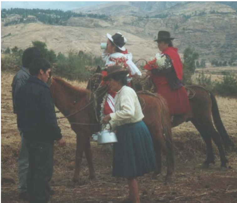
De bruid en de peetmoeder, madrina worden feestelijk in een dorp onthaald. Bij aankomst wordt hen eerst drank aangeboden.

Ook het "Vragen-om-de-hand"-ritueel is een goed voorbeeld van het aangaan van banden. De ouders of de doopvader van de jongen gaan naar de ouders van het meisje om goedkeuring te vragen voor het huwelijk. Om de ouders van het meisje gunstig gestemd te krijgen wordt er eten maar vooral veel drank meegenomen. De ouders van het meisje zullen bij goedkeuring op hun beurt de ouders van de jongen voor een maaltijd uitnodigen.