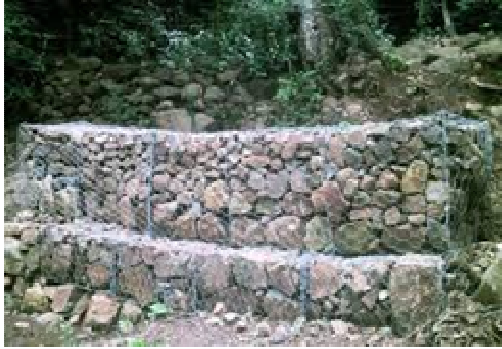
Oeverbescherming met 'gaviones'

Gaviones zijn te kostbaar voor de boeren om zelf te betalen. Zij hebben de SHI gevraagd om een financiële bijdrage voor het benodigde materiaal. De aanleg wordt door hen zelf gedaan. De SHI stelt hiervoor 3000 euro beschikbaar. Zo kan een begin worden gemaakt met de oeverbescherming.