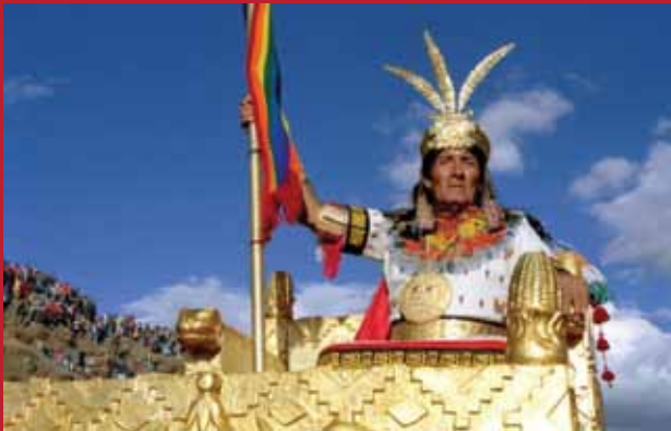
De Inca tijdens het Inti Raymi festival in Cusco

De ceremonie werd sinds 1944 nieuw leven ingeblazen voor de toerisme industrie en is uitgegroeid tot een groots spektakel waar vele duizenden mensen op afkomen. Goede zitplaatsen kosten honderden dollars en grote beroemdheden worden er gesignaleerd zoals Bill Gates en Leonardo di Caprio.