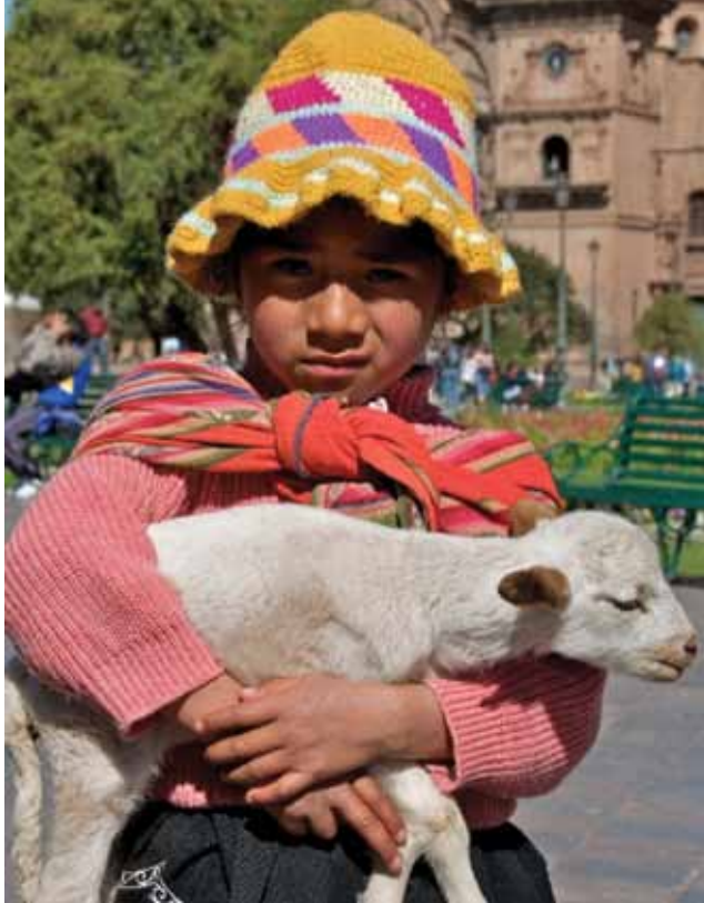
Meisje neemt lammetje mee naar Cusco voor toeristen