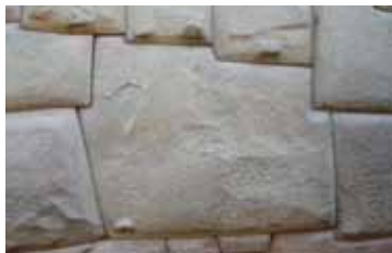
Inca steenhouwerij: de beroemde 12 hoekige steen in Cusco

Het machtige Andesgebergte is net als de andere grote bergketen in de wereld – de Himalaya - omgeven door mystiek. Ondanks vermenging met Christelijke elementen maakt de inheemse natuurreligie (zie kader) nog steeds deel uit van het dagelijkse leven op het platteland. Deze natuurreligies zijn duidelijk terug te vinden in de grote Andes beschavingen, zoals Chavin (1200-500 vChr.), Mochica (0-600 nChr.), Tiwanaku (200-1100 nChr.), en natuurlijk de Inca (1300 -1530 nChr.) Hun kunstzinnigheid, vakmanschap en diepe kennis van astrologie zijn Westerse wetenschappers van vandaag nog steeds een raadsel. Hoe hebben mensen die gigantische rotsblokken in Macchu Picchu kunnen verplaatsen en naadloos op elkaar laten aansluiten? Wie op deze plaats is geweest of op een van de andere Inca sites in de heilige vallei zoals Ollantaytambo, Pisac of Cusco, ziet al snel dat de constructies ook een religieuze betekenis hebben. De stijl waarin hun bouwkundig