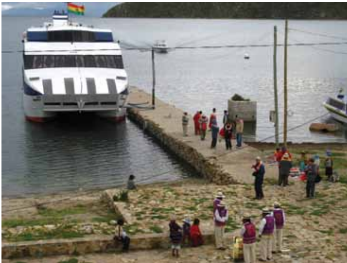
De Transturin catamaran in Challapampa

Heel anders is de beeldvorming van Indianen in het zogenaamde georganiseerd toerisme. De georganiseerde toerist heeft zijn trip tot in de puntjes geregeld en laat zo weinig mogelijk aan het toeval over. De georganiseerde toerist betaalt zijn of haar geld en wil zich verder geen zorgen maken over zaken als comfort of planning van de reis. Het kan er in deze 'derde wereld' landen immers onveilig zijn en men spreekt er doorgaans geen Engels.