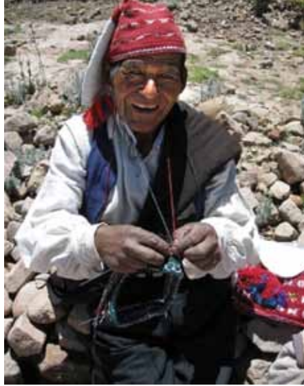
Taquile bewoner breit een muts

die gebruikt wordt om infrastructuur te bouwen in toerisme, zoals verlichting, boten en onderwijs in toerisme. Sinds enkele jaren hebben ze hun eigen promotieflyers, waarbij ze zichzelf portretteren als trotse eigenaren van een levende, rijke cultuur. Ze omarmen westerse levensartikelen zoals televisie, radio, mobiele telefoons, gaskeukentjes en integreren het toerisme door ze in hun manier van leven. Sommigen vertrekken naar de stad voor enkele jaren om geld te verdienen zodat ze een mooi huisje kunnen bouwen op hun eigen terrein. In veel gevallen bouwt men een restaurant of hostel om toeristen te kunnen ontvangen.