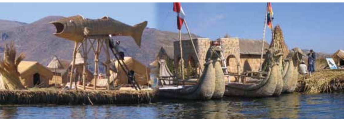
Uru Eilanden in Peru

De Uru hebben een groot scala aan bouwwerken gemaakt voor toeristen, van rieten uitkijkposten, tot boten in allerlei vormen en maten. Toeristen kunnen kort aanmeren op een eilandje om te voelen hoe de drassige ondergrond meedeint met elke voetstap. Vrouwen verkopen zelf geborduurde souvenirs en in een emmer kan je lokale visjes genaamd 'kharachi' zien zwemmen en vervolgens een kom traditionele soep proberen gebaseerd op deze zelfde vis, genaamd 'wallak'e'.