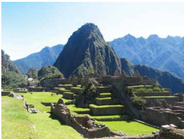
Macchu Picchu: de voornaamste toeristische trekpleister van de Andes

komen want dat zou de energie beïnvloeden. Verderop lopend zag ik het volgende tafereel: in een uithoek van het ruïnecomplex met uitzicht op de berg Putucusi ('gelukkige berg' in het Quechua), gaf een mystieke gids haar groep reizigers op klaarlichte dag een intense spirituele zuivering. Hierbij moesten de bezoekers op het Inca balkon staan en hun emoties de vrije loop laten. Een vrouw van middelbare leeftijd begon met haar armen te wapperen en oergeluiden uit te schreeuwen. Daarna werd ze getroost door de gids. Op Macchu Picchu ('oude berg' in het Quechua) worden New Agers verlost van negatieve emoties en gezuiverd om deel te worden van een nieuwe religieuze orde, precies zoals staat beschreven in de bestseller de 'Celestijnse Belofte'.