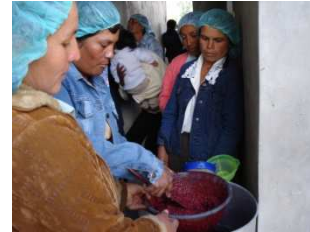
Het zeven van de bramenjam