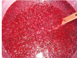
Bramenjam in de maak

De laatste drie jaar heeft de NGO onder andere gewerkt met een groep van 30 boerenvrouwen , die jam, nectar en siroop maken van inheemse fruitsoorten van de Andes. De NGO heeft de vrouwen geschoold in het produceren volgens de normen voor voedsel en hygiëne en in merchandising van de producten.