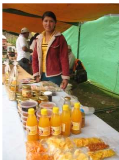
Verkoop van de producten op een markt.

Tot nu toe hebben zij hun producten aangeboden op verschillende festivals en markten. Deze evenementen zijn echter incidenteel van aard en bovendien is het doel vaak meer het promoten van de producten dan de verkoop. De vrouwengroep heeft nog geen eigen verkooppunt (zoals een winkeltje).