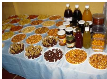
Een deel van de producten: tomatillo met een chocolade laagje, chips, jam, gebakken mais, sap en rozijnen van tomatillo.