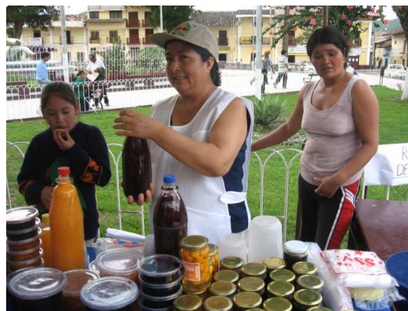
De vrouwen verkopen hun producten op de lokale markt en op evenementen door het hele land

Vanwege de relatief hoge kosten voor de vrouwen om van hun dorpjes naar de stad te reizen om de producten te vervaardigen, zien veel van hen geen kans om nog langer door te gaan met de activiteiten.