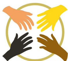
DRUMCEREMONIE MET EEN BOODSCHAP Inheemse Volken laten van zich horen

Tijdens een ' Drumceremonie met een boodschap ' is op 13 september 2010 in Den Haag politieke aandacht gevraagd voor de positie van inheemse volken wereldwijd. Op die dag was het precies drie jaar geleden dat de Verklaring van de Rechten van de Inheemse Volken werd aangenomen door de Verenigde Naties, waarin de rechten op zelfbeschikking, land, scholing, cultuur, religie en taal van inheemse volken zijn erkend. Helaas worden die rechten nog altijd op grote schaal geschonden.