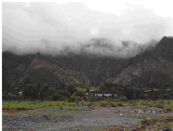
Een uitzicht op het dorp