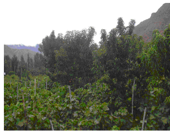
Akkers met druiven en perzik