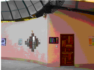
De grote zaal met een "Chacana" of Kruis van de Andes, een oud aymara