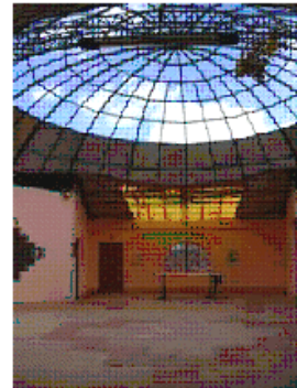
De grote zaal (de afwerking van het dak is nog niet af)