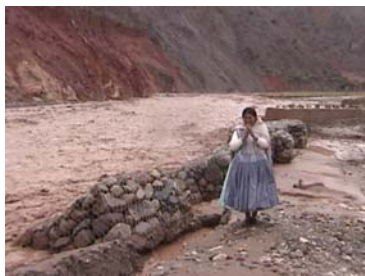
De woeste rivier van Luribay, februari is zomer en regen seizoen