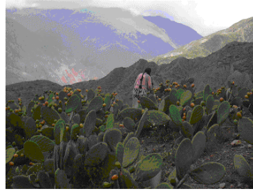
De cactus velden vlakbij Luribay