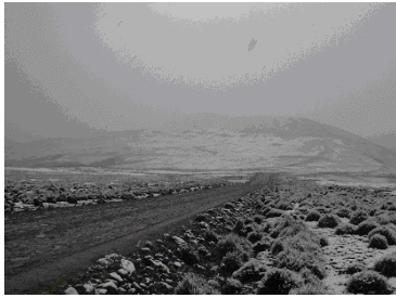
Onderweg naar Luribay, een plaats genoemd "La Cumbre" 4000 meter. Er lag sneeuw