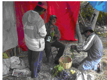
Boeren die druiven selecteren om te verkopen op de markt